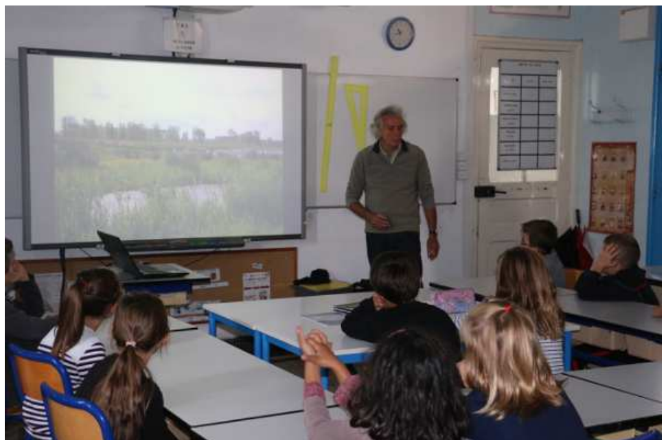
Les élèves très attentifs pendant l'exposé.

Nous avons assuré une intervention dans les classes le 5 octobre et nous accompagnerons les élèves dans le marais au printemps pour observer les cigognes.