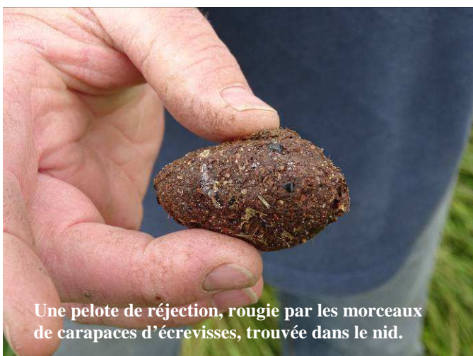
Une pelote de réjection, rougie par les morceaux de carapaces d'écrevisses, trouvée dans le nid.