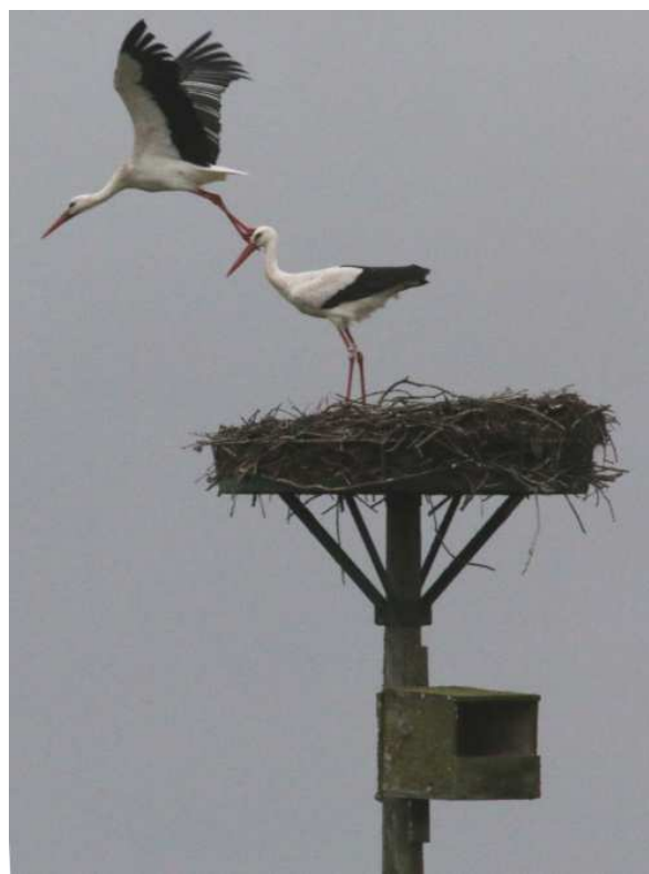
Le couple a pris possession du nid sur la plate-forme des Gannes à Vue

Ce n'est pas encore le printemps mais déjà de nombreuses cigognes occupent les nids. Pas toujours faciles à identifier en lisant les bagues, elles sont plutôt farouches et s'envolent quand on les approche de trop près.