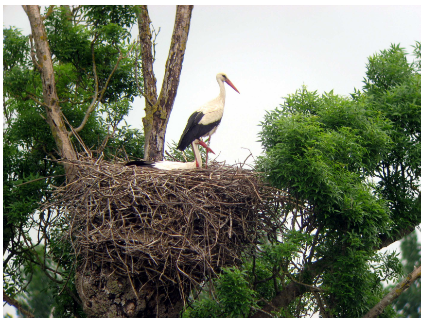
Deux nids à Couëron dans le marais Audubon