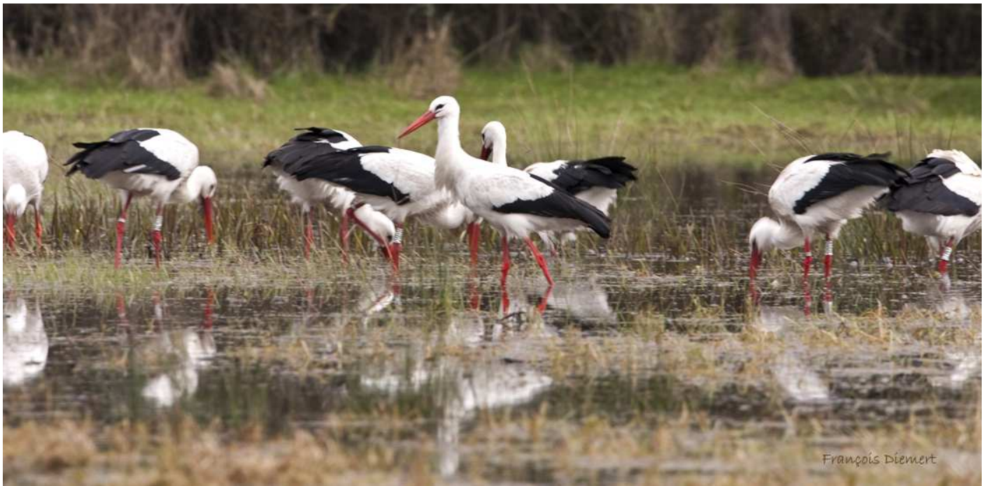
Janvier 2013, un groupe de cigognes fréquente régulièrement une prairie humide en plein bourg de Vue.

Certains cigognes faisaient des allers-retours entre ces sites et la décharge de Grand'Landes en Nord Vendée.