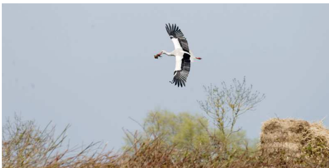
Apport de matériaux pour la construction du nid.

Le printemps très humide n'a finalement pas eu de grosses conséquences dans la reproduction des cigognes en Loire-Atlantique. On constate seulement qu'il n'y a pas eu d'évolution entre 2012 et 2013 dans les effectifs nicheurs et le nombre de poussins. L'effort de baguage s'est accentué en 2013 dans le cadre du programme déposé pour le compte du groupe Cigognes-France.